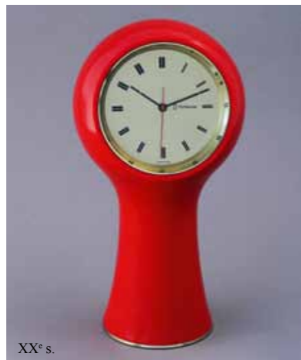
XX e s.