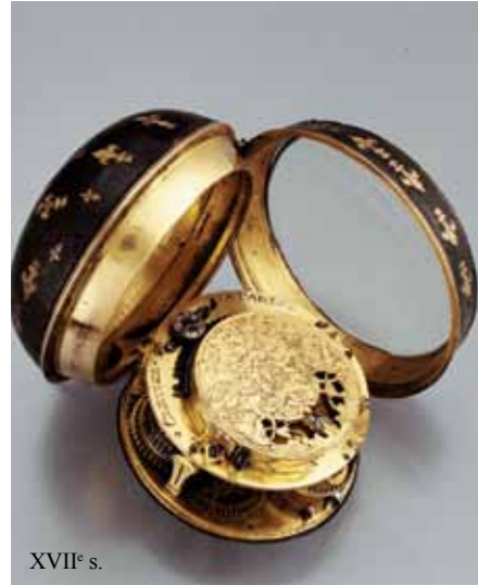
XVII e s.

La plus grande mutation dans les travaux d'actualisation de l'exposition du musée international d'horlogerie se trouve dans ce qu'on appelle l'Espace second, la partie haute du musée. Celle-ci change complètement d'atmosphère.