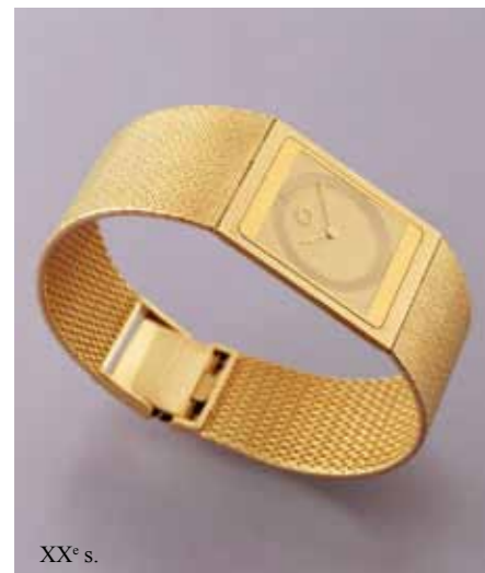
XX e s.

Mais la préoccupation majeure de la seconde moitié de l'année 2012, après l'exposition Automates & merveilles, sera la création de trois nouveaux espaces :