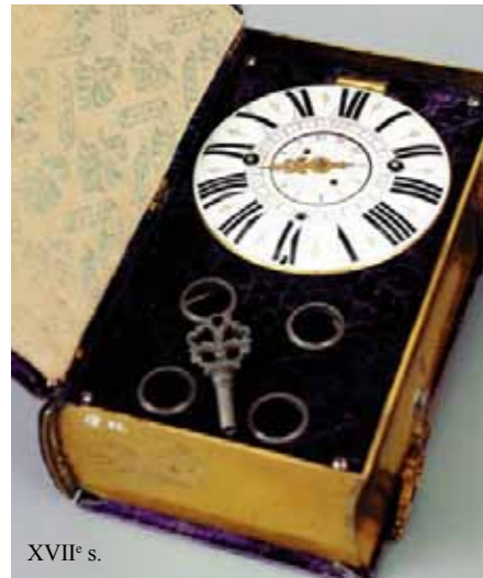
XVII e s.

Au centre de l'espace, la zone multimédia a émigré de la fosse à cet emplacement. Les visiteurs s'y arrêtent fréquemment et une extension de l'offre est en cours : au film de Cartier consacré à l'histoire de la mesure du temps, va s'ajouter le film Hans Erni, La Conquête du Temps qui présente les fresques du très grand peintre et les collections du musée. Ainsi qu'à terme, les extraits des films des horloges et automates en mouvements qui figureront dans l'exposition Automates & merveilles.