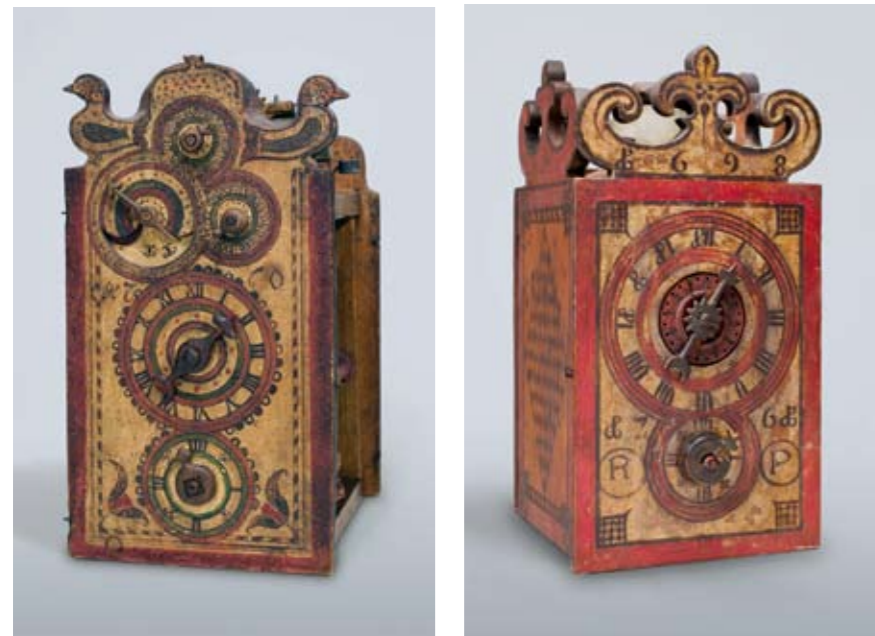
Collection privée