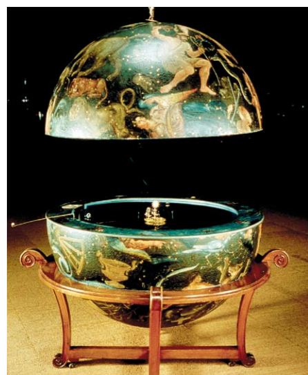
Outre des visites de l'exposition temporaire, cette nuit des révolutions fera la part belle à celle que les planètes font autour du soleil grâce au planétaire de François Ducommun qui sera mis en mouvement à 20h00, 21h00, 22h00 et 23h00.